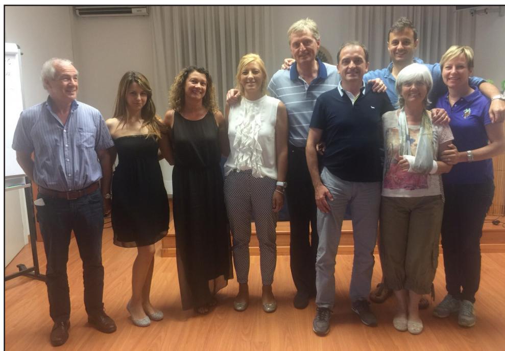
Dinamiche della Mente e del Comportamento - luglio 2015 - Vicenza