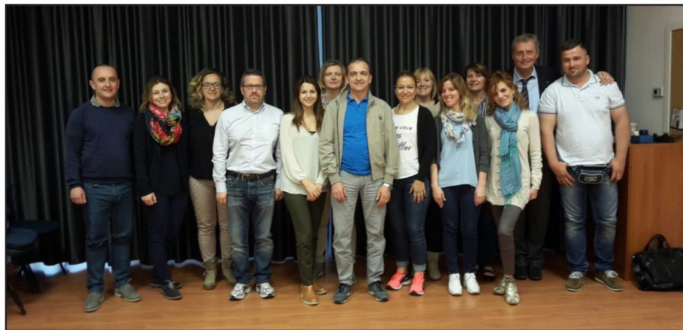
Rilassamento antistress - maggio 2015 - Vicenza