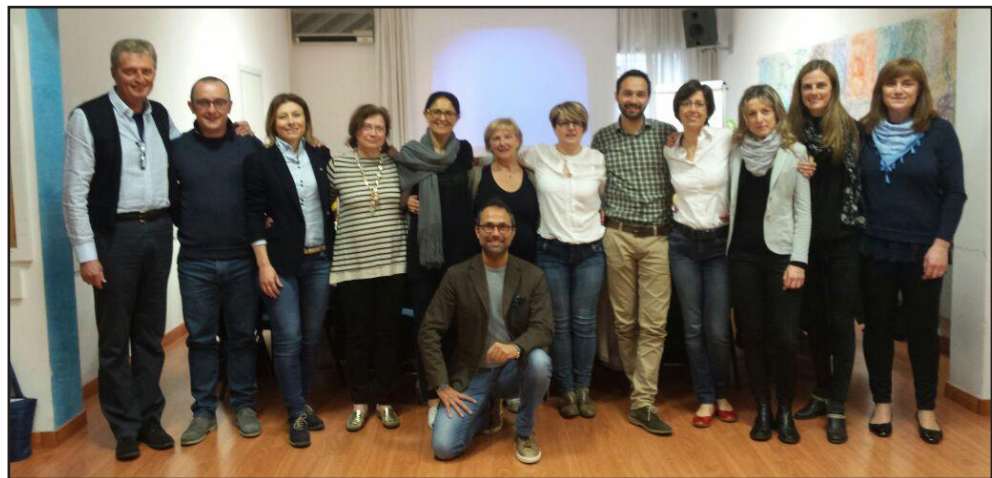
Public Speaking - maggio 2015 - Vicenza