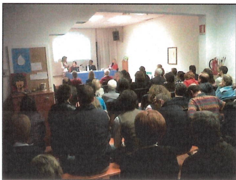
Vicenza - Presentazione del libro - 23 aprile 2013