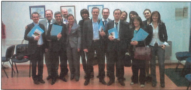
Vicenza, 30 marzo 2012 - Giornata Antistress per operatori della Banca del Centroveneto